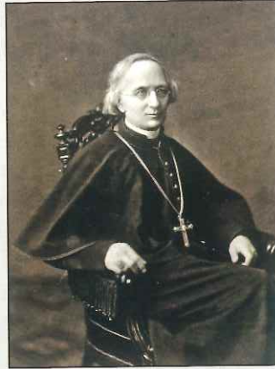
Kard. Albin Dunajewski

i następców tytuł księżęcy. W 1890 r. papież Leon XIII ustanowił go kardynałem. Jako pasterz diecezji przyczynił się do jej rozszerzenia w latach 1880 i 1886 diecezji krakowskiej oraz podniesienia rangi krakowskiego Kościoła. Brał udział w patriotycznych obchodach, inicjował akcje charytatywne, wspierał rozwój religijnych stowarzyszeń, wydawnictw i budownictwa sakralnego. Spoczywa w katedrze na Wawelu, pod konfesją św. Stanisława.