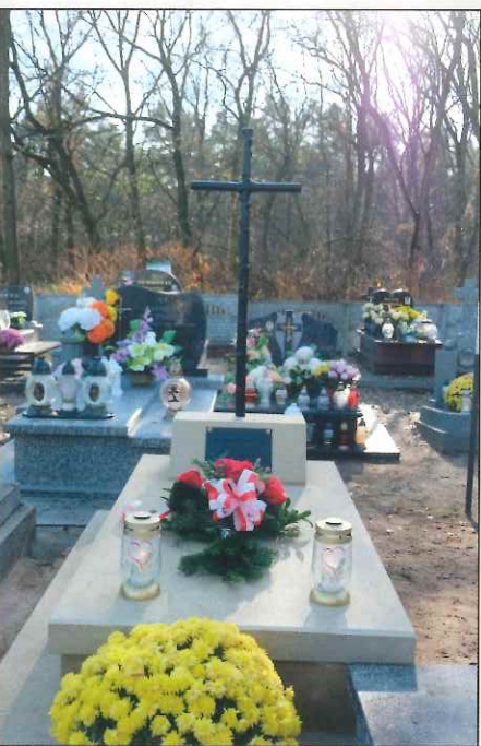
Grób mjra E. Dunajewskiego w Szczucinie