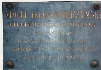
Dobrzyńscy – napisy w Kaplicy w Łęgu Tarnowskim