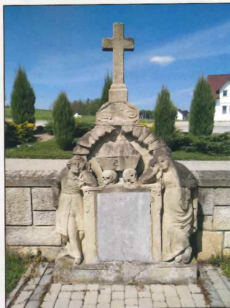
Grób A. Dobrzyńskiej w Jastrzębi z 1842 r.