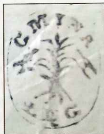
Pieczęć gminna Łęgu