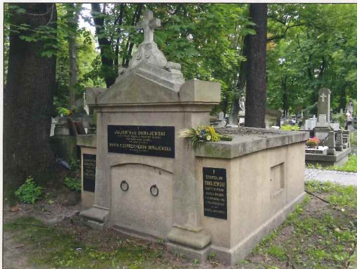
Grób Dunajewskich, Cmentarz Rakowicki w Krakowie