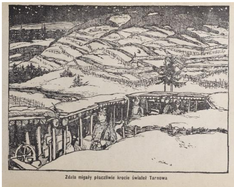
Ilustracja z książki Boje legionistów polskich. Bitwa pod Łowczówkiem, Piotrków 1916 .

Na pierwszej stronie Cmentarz Legionistów w Łowczówku, Andrzej B. Krupiński